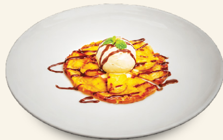
Banana Crepe Vanilla Ice Cream, Chocolate Sauce Bánh kẹp chuối, kem vani, sốt sô cô la 香蕉可丽饼、搭配香草冰淇淋、巧克力酱 바나나 크레페, 바닐라 아이스크림, 초콜릿 소스

P: Pork Dish/ Món thịt heo - S: Spicy Dish/ Món cay - N: Nut Dish/ Món đậu, hạt - V: Vegetarian Dish/ Món chay