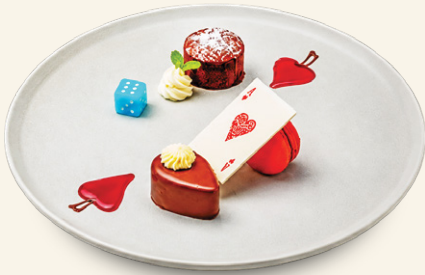
The Grand Bistro Trio Dessert (N) Chocolate Volcano, Raspberry Macaron, Salted Caramel Nougatine Mousse Bánh sô cô la chảy, bánh macaron vị mâm xôi, bánh sô cô la nhân caramen mặn Grand Bistro 甜点三重奏 巧克力熔岩、覆盆子马卡龙、咸焦糖牛轧糖慕斯 그랜드 비스트로 트리오 디저트, 초콜릿 볼케이노, 라즈베리 마카롱, 솔티드 카라멜 누가틴 무스