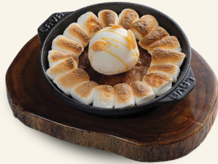
The Bistro Cookie Skillet (N) Toasted Almond, Vanilla Ice Cream, Caramel Sauce Bánh quy nướng lò củi, hạnh nhân, kem vani, sốt caramen 酒馆铁盘曲奇、搭配烤杏仁、香草冰淇淋、焦糖酱 비스트로 쿠키 스킬렛, 구운 아몬드, 바닐라 아이스크림, 카라멜 소스